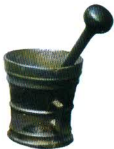
Ryc. 101. Moździerz z Apteki „Ratuszowej” w Gdańsku

Apteką „Pod Orłem” w Pelplinie Apteką „Z. Pawłowski” w Barwicach Apteką „Nadworną” w Chojnicach Apteką „Pucką” w Pucku Apteką „Romańską” w Strzelnie Apteką „Nową” w Stargardzie Szczecińskim Apteką „Pod Orłem” w Nowem n. Wisłą Apteką „Pod Krzyżem” w Inowrocławiu Apteką „Pod Orłem” w Świeciu n. Wisłą Apteką „Klaudiusza Galena” w Gniewie Apteką „Tradycyjną” w Gdańsku Apteką „Gdańską” w Gdańsku Apteką „Pod Modrakiem” w Brusach Apteką „Pod Orłem” w Kcyni Apteką „Pod Łabędziem” w Bydgoszczy Apteką w Łasinie Apteką „Pod Orłem” w Sopocie Apteką „Pod Gryfem” w Gdyni Apteką „Nadmorską” w Gdyni Apteką „Lwowską” w Szczytnie Apteką „Pod Niedźwiedziem” w Kościerzynie Apteką „Kociewską” w Starogardzie Gdańskim