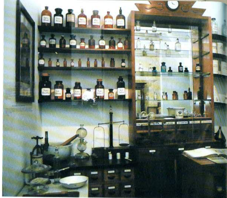
Ryc. 100. Fragment ekspozycji wnętrza starej apteki — Muzeum Historyczne Miasta Gdańska