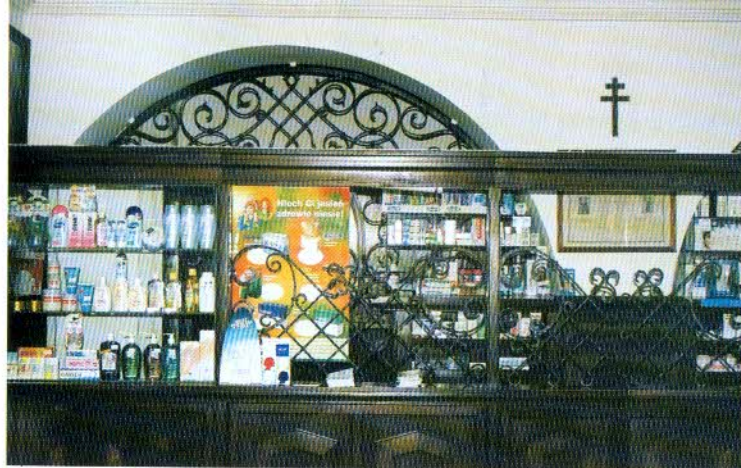
Ryc. 97. Wnętrze zabytkowej Apteki „Ratuszowej” w Gdańsku